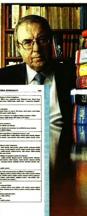
Το ένατο λεξικό του Γεώργιου Μπαμπινιώτη προβλέπεται να εξελιχθεί σε πολύ χρήσιμο εργαλείο δασκάλων και μαθητών

τες λέξεις της ελληνικής. Παράγωγα και σύνθετα των λέξεων της γλώσσας μας είναι «τα παιδιά και τα εγγόνια των λέξεων», δηλώνει παραστατικά ο Γεώργιος Μπαμπινιώτης, δείχνοντας πως η λέξη-παιδί σέβας , το οποίο παράγει τη λέξη-μάννα σεβάσμοι δίνει τη λέξη-παιδί σέβας , το οποίο παράγει τη λέξη-εγγόνι σεβάσμοι , που χάθηκε νομικά, αλλά άφρασε απογόνους τις λέξεις-δισέγγονα σεβαστός, σεβαστικός, σεβασμός , το τρισεγγόνο σεβάσμιος και με τους δικούς του απογόνους, πανσεβάσμιος, αλληλοσεβάσμιος κ.ά.